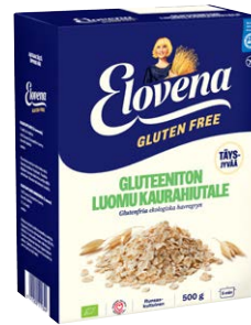
ELOVENA GLUTEENITON LUOMU KAURAHIUTAILE 500 G KEITTOAIKA: 5 MIN

Ainesosat: Gluteeniton luonnon- mukaisesti viljelty täysjyvä kaura .