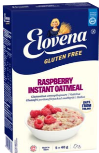
ELOVENA GLUTEENITON ANNOS- PIKAPUURO VADELMA 200 G, 5 X 40 G

Kätevät annospussit on helppo ottaa mukaan.