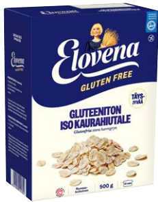
ELOVENA GLUTEENITON ISO KAURAHIUTAILE 500 G KEITTOAIKA: 12 MIN

Runsaskuituiset täysjyväkaurahiutaleet sopivat puuroihin ja leivontaan. Ne sisältävät vain vähän FODMAP-hiilihydraatteja ja sopivat siksi myös herkkävatsaisille.